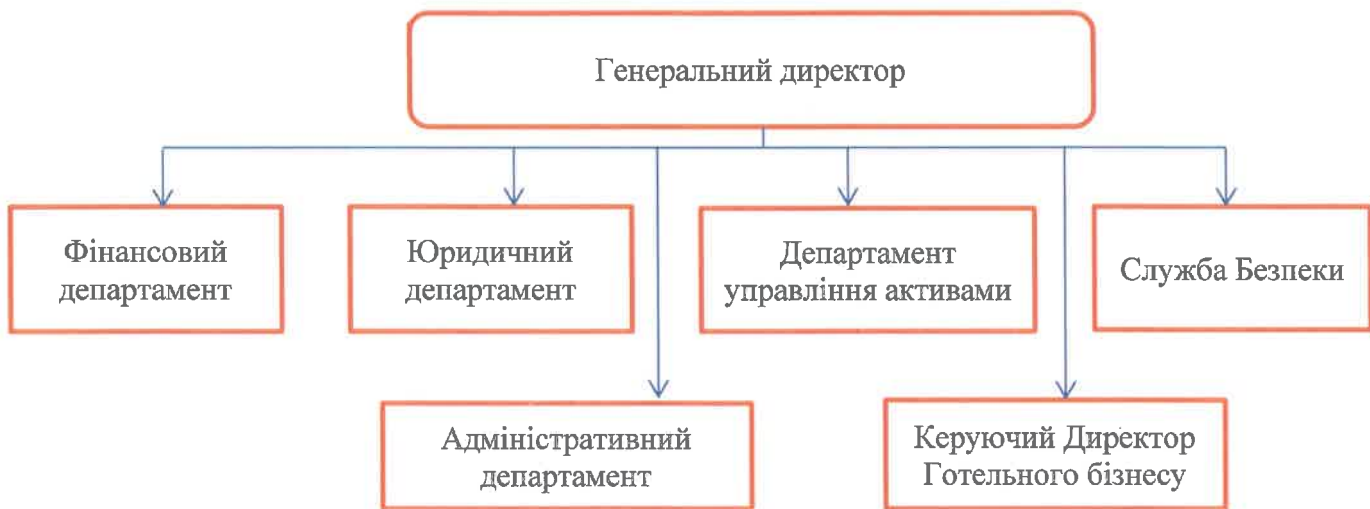
Схема. 1 Організаційна структура ТОВ «ECTA ХОЛДИНГ»

ТОВ «ECTA ХОЛДИНГ» здійснює весь цикл необхідних робіт на всіх стадіях розвитку проектів, починаючи з первинного аналізу інвестиційної пропозиції і закінчуючи девелопментом і експлуатацією реалізованого проекту. Компанія фокусується на інвестиційних проектах високої якості, унікальних з точки зору архітектури, якості реалізації або суспільного значення.